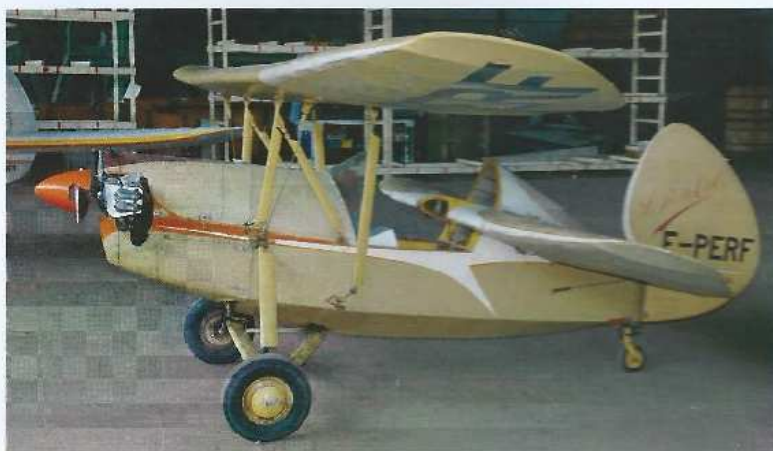
HM290 « Petit Bouquet » F-PERF