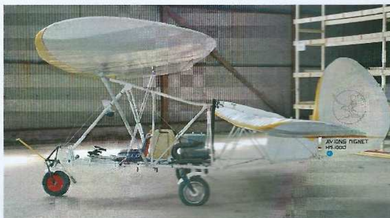
HM1000 « BALERIT »