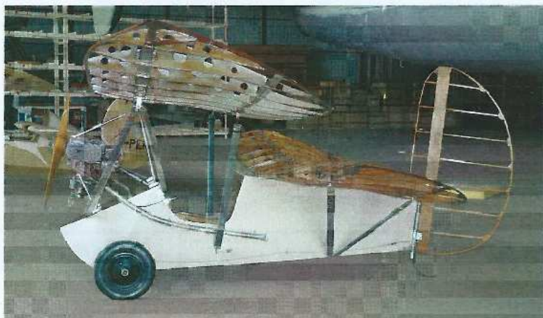
HM14 « Pou du Ciel »